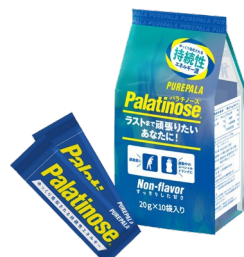
携帯用20gスティックタイプ

パラチノース®は植物（てん菜）由来で、はちみつにも含まれる天然の糖質です。砂糖と同じくブドウ糖と果糖が繋がった二糖類で、エネルギー量も同じ（1gあたり4kcal）ですが、吸収スピードが砂糖の約5分の1という特性をもっています。その特性から、パラチノース®は持久系スポーツに適したエネルギー源といわれ、科学的な知見からアスリートのパフォーマンスアップに貢献できます。このパラチノース®原料を100%配合した“ピュアパラ”はロードバイクやマラソンといった持久系スポーツ選手や、トレーニーに愛飲いただいています。