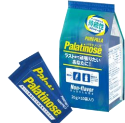
携帯用 20g スティックタイプ

パラチノース®は植物（てん菜）由来で、はちみつにも含まれる天然の糖質です。砂糖と同じブドウ糖と果糖がつながった二糖類で、エネルギー量も同じ（1gあたり4kcal）ですが、吸収スピードが砂糖の約 5 分の 1 という特性をもっています。その特性から、パラチノース®は持久系スポーツに適したエネルギー源といわれ、科学的な知見からアスリートのパフォーマンスアップに貢献できます。このパラチノース®原料を 100%配合した商品『ピュアパラ』はロードバイクやマラソンといった持久系スポーツ選手や、トレーニーに愛飲いただいています。