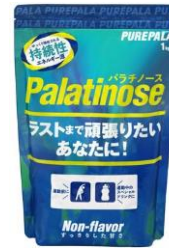
徳用 1kg タイプ