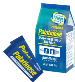
携帯用20gスティックタイプ

パラチノース®は植物（てん菜）由来で、はちみつにも含まれる天然の糖質です。砂糖と同じくブドウ糖と果糖がつながった二糖類で、エネルギー量も同じ（1gあたり4kcal）ですが、吸収スピードが砂糖の約5分の1という特性をもっています。その特性から、パラチノース®は持久系スポーツに適したエネルギー源といわれ、科学的な知見からアスリートのパフォーマンスアップに貢献できます。