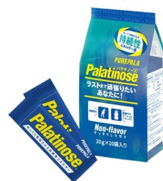
携帯用 20g スティックタイプ

パラチノース®は植物（てん菜）由来で、はちみつにも含まれる天然の糖質です。砂糖と同じブドウ糖と果糖がつながった二糖類で、エネルギー量も同じ（1gあたり4kcal）ですが、吸収スピードが砂糖の約5分の1という特性をもっています。その特性から、パラチノース®は持久系スポーツに適したエネルギー源といわれ、科学的な知見からアスリートのパフォーマンスアップに貢献できます。このパラチノース®原料を100%配合した商品『ピュアパラ』はロードバイクやマラソンといった持久系スポーツ選手や、トレーニーに愛飲いただいています。