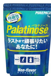
徳用 1kg タイプ