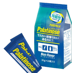
携帯用 20g スティックタイプ

パラチノース®は植物（てん菜）由来で、はちみつにも含まれる天然の糖質です。砂糖と同じくブドウ糖と果糖がつながった二糖類で、エネルギー量も同じ（1gあたり4kcal）ですが、吸収スピードが砂糖の約 5 分の 1 という特性を持っています。その特性から、パラチノース®は持久系スポーツに適したエネルギー源といわれ、科学的な知見からアスリートのパフォーマンスアップに貢献できます。このパラチノース®原料を 100%配合した商品『ピュアパラ』はロードバイクやマラソンといった持久系スポーツ選手や、トレーニーに愛飲いただいています。