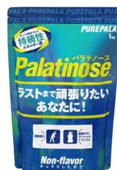
徳用 1kg タイプ