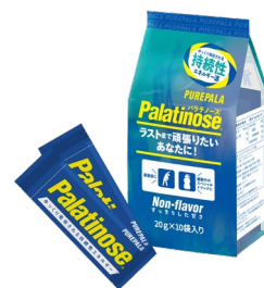
携帯用 20g スティックタイプ

パラチノース®は植物（てん菜）由来で、はちみつにも含まれる天然の糖質です。砂糖と同じくブドウ糖と果糖がつながった二糖類で、エネルギー量も同じ（1gあたり4kcal）ですが、吸収スピードが砂糖の約5分の1という特性をもっています。その特性から、パラチノース®は持久系スポーツに適したエネルギー源といわれ、科学的な知見からアスリートのパフォーマンスアップに貢献できます。このパラチノース®原料を100%配合した商品『ピュアパラ』はロードバイクやマラソンといった持久系スポーツ選手や、トレーニーに愛飲いただいています。