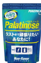
徳用 1kg タイプ